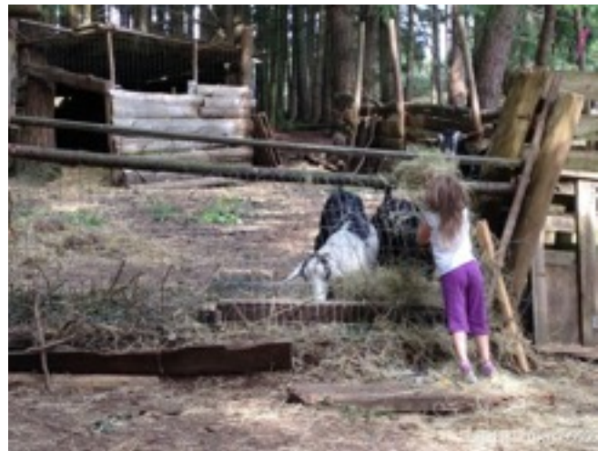
孩子们从小就亲近自然，与动物友善